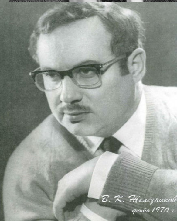
В. К. Железников фото 1970 г.

Владимир Железников родился 26 октября 1925 г. в г. Витебск. Отец служил в пограничных войсках, и семье приходилось часто переезжать. Будущему писателю это давало возможность постоянно общаться с новыми людьми. Мальчик с детства хотел стать военным, поэтому во время Великой Отечественной войны решил последовать примеру отца и поступил в артиллерийское училище, которое окончил с отличием. Во время войны он вёл дневниковые записи, писал очерки военных будней. В 1945 г., сразу после войны, Владимир Железников продолжал заниматься литературой. Через некоторое время он решил получить соответствующее образование и поступил в Литературный институт им. М. Горького, который успешно окончил в 1957 г.